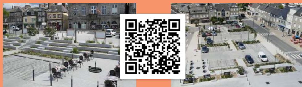
La nouvelle Place de l'Hôtel de Ville ▶ Scannez le QR code pour avoir accès au timelapse des travaux.

• Programme de voirie 2025 : réfection de la chaussée Boulevard des Merisiers (de la Tourelle au carrefour de la route de Cuves) réalisée par l'entreprise PIGEON TP pour 193 370,40 TTC et 9 668,52 € TTC de prestation de maîtrise d'œuvre du CD50.