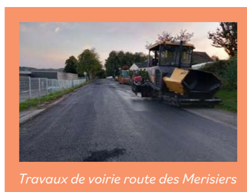
Travaux de voirie route des Merisiers

• Matériel mairie : changement du serveur en achat et remplacement d'un PC = 25 170,60 € TTC.