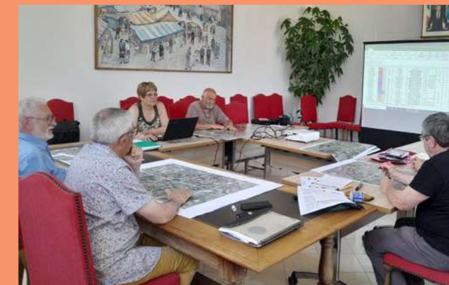
La commission « Adressage »