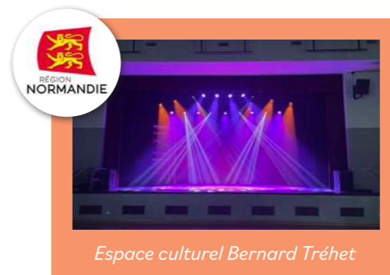
Espace culturel Bernard Tréhet