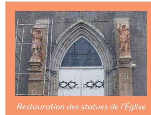
Restauration des statues de l'Église

➔ Une première étape a débuté en parallèle avec la restauration des 2 statues sur le parvis (François ROUCHET 7 920 € TTC).